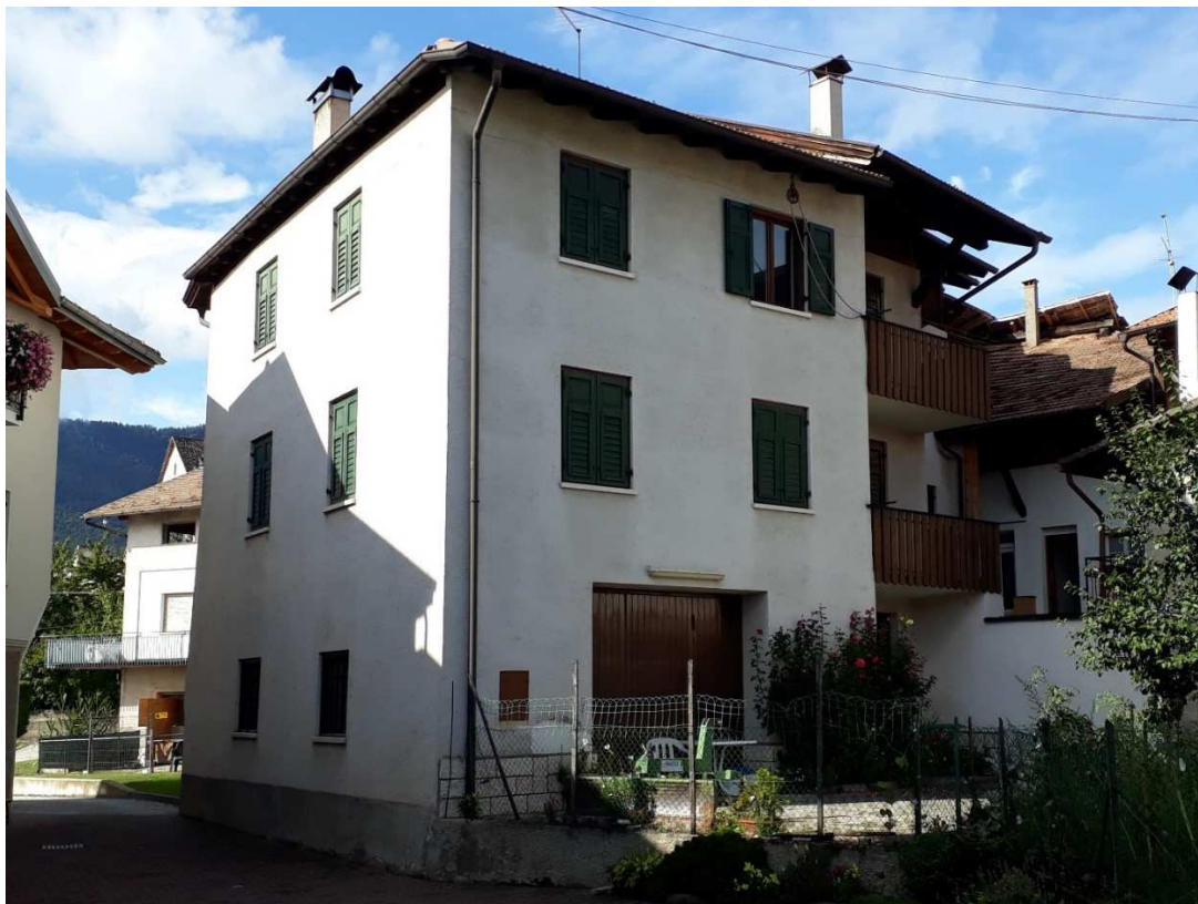
Vista da sud