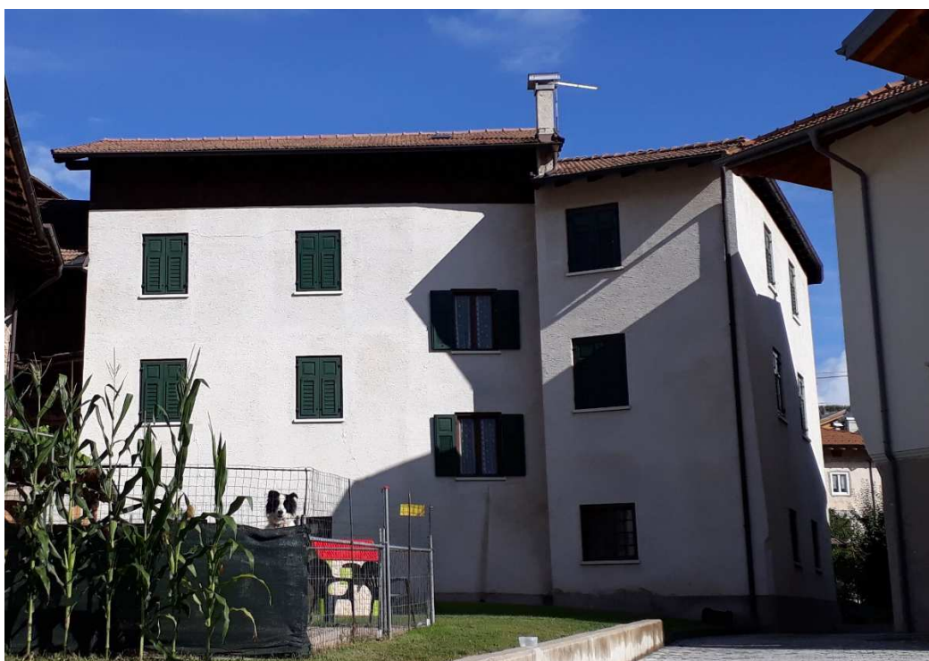
Vista da ovest